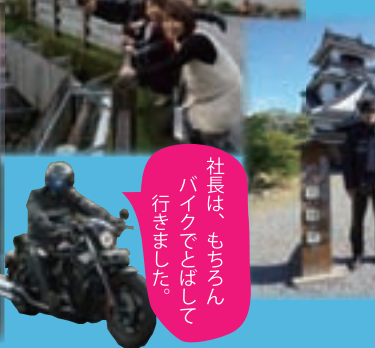
社長は、もちろんバイクでござって行きました。