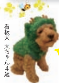
看板犬 天ちゃん4歳

ボクから、みなさまにお知らせ。 今年も、5月に恒例の自社イベント開催するよ！ 昨年好評だったマルシェを今年も準備してるんだ。 美味しいものに興味のある人はお楽しみに。お知らせするね。