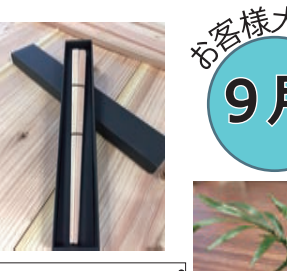
ワークショップ お箸づくり コケリウム

お箸づくりでは、カンナを使ってお箸の形に削り出していきます。それぞれ個性があるお箸が誕生していました。コケリウムは毎回大人気。こちらも個性がある自分だけの世界を楽しんで下さっていました。