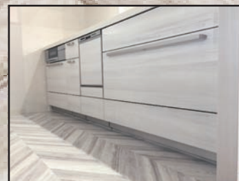
キッチン: クリナップ「ステディア」