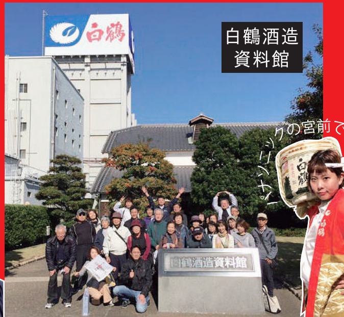
お酒の試飲は勿論、充実した資料館、酒粕ソフトクリームなどもあり、白鶴さんを満喫しました!