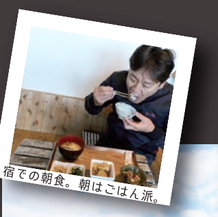
宿での朝食。朝はごはん派。