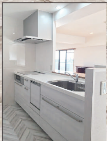
白の木目扉が落ち着いた印象に。引出し式で、収納たっぷり。