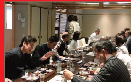
櫻正宗 櫻宴にてお食事風景。お酒も少し入って、皆さん楽しく過ごして下さいました。私達も楽しかったです!!