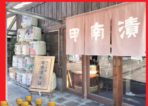
甲南漬はみりんの製造から始まったそうです。「はくびし本みりん」飲めるんです。是非お試し下さい。