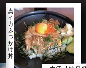
真イカふっかけ丼