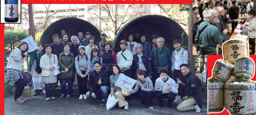
大きな大きな酒樽の前で集合写真。