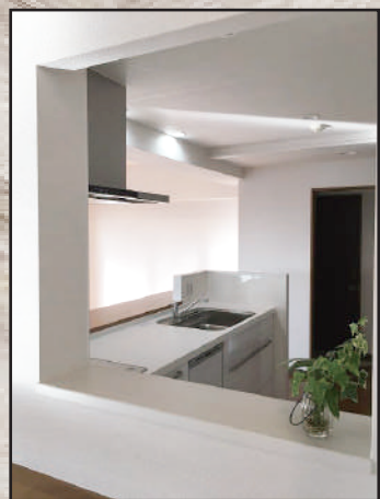
コンロ横壁のニッチ。キッチン・リビングを可愛らしく演出してくれます。